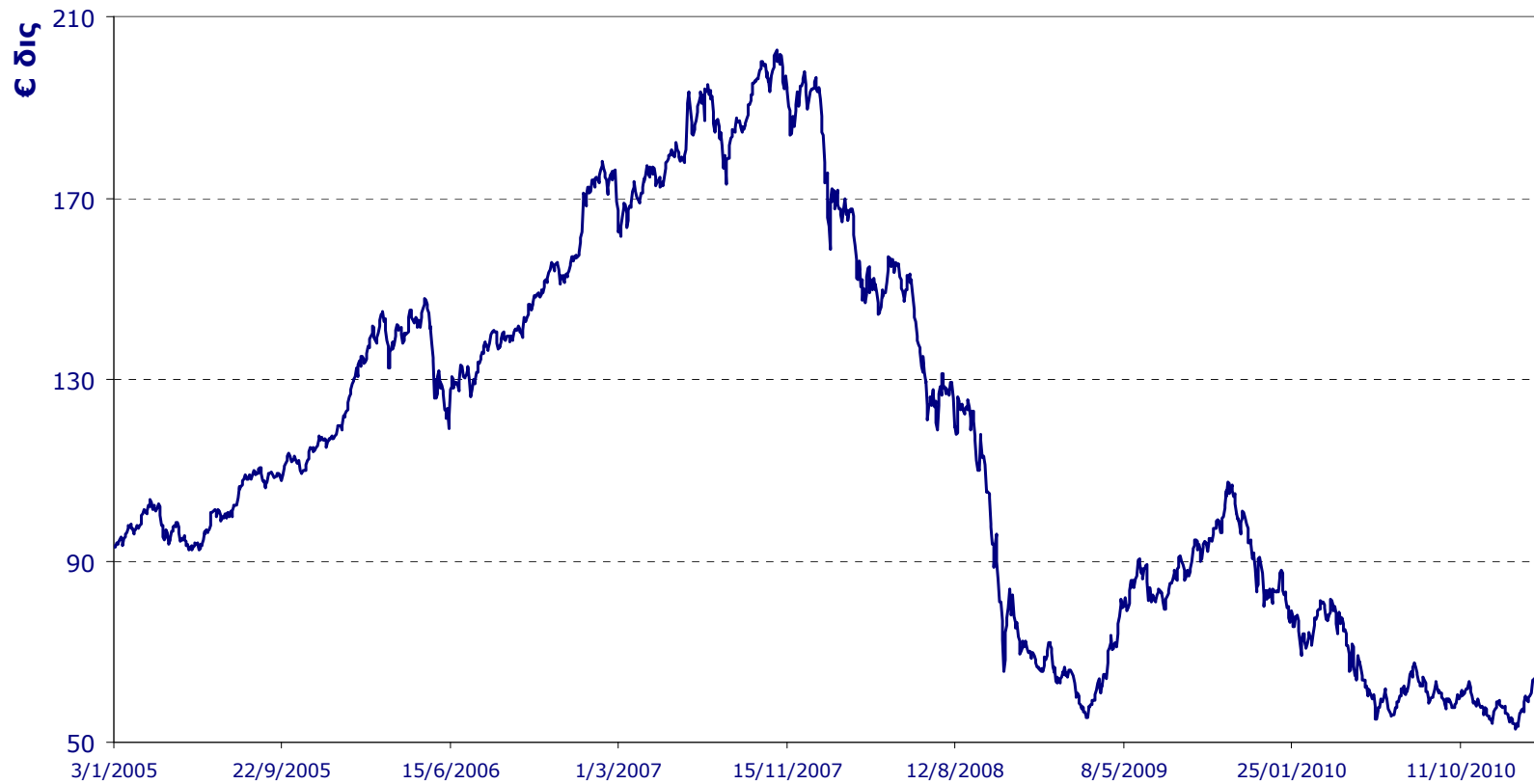
Κεφαλαιοποίηση Αγοράς Μετοχών ΧΑ